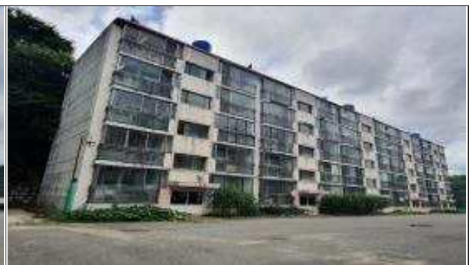
사업부지 전경(건월마을아파트 나동)