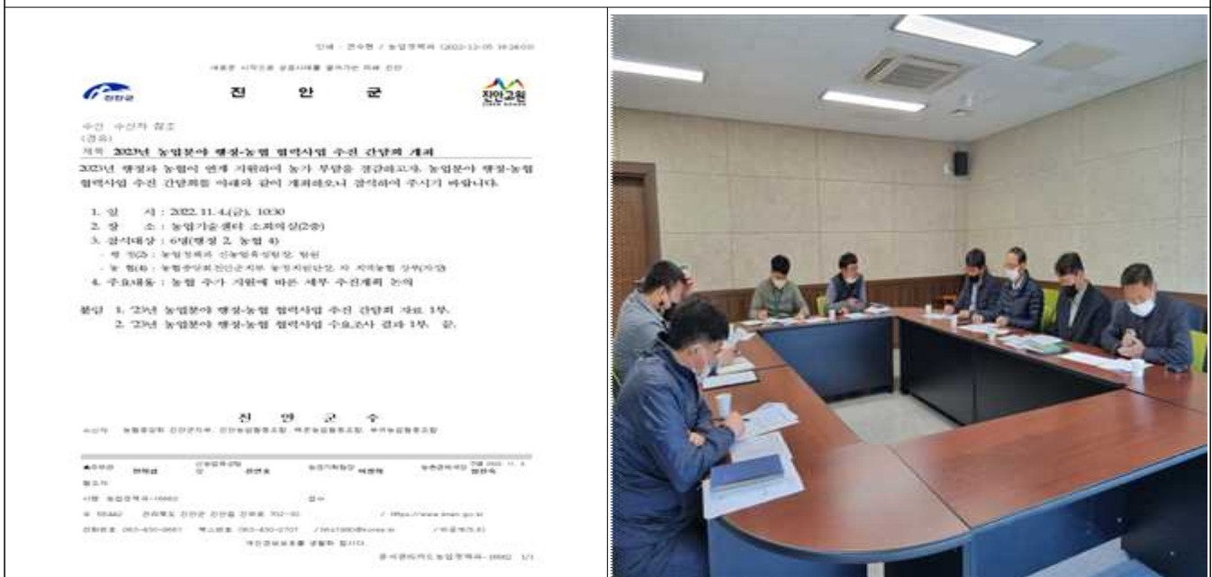
농업분야 행정-농협 협력사업 추진간담회 개최(2022.11.4.)