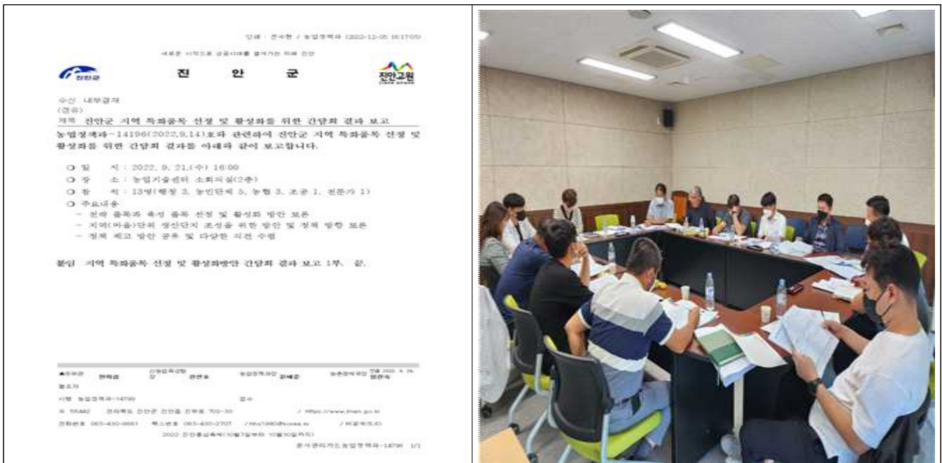
지역 특화품목 선정 및 활성화를 위한 간담회 개최(2022.9.21.)