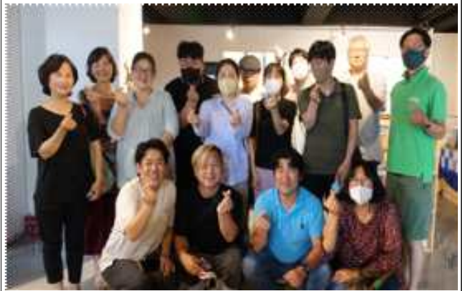
△2022 사회적경제 기본교육