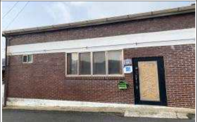
△2023 사회적경제 청년심터 운영