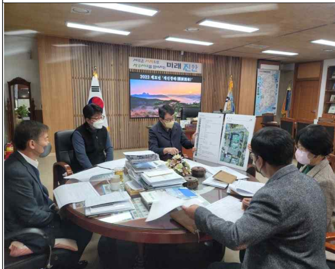
기숙사 실시설계에 따른 중간보고회(23.1.18.)