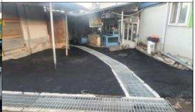
우화지구 골목길 재포장(후)