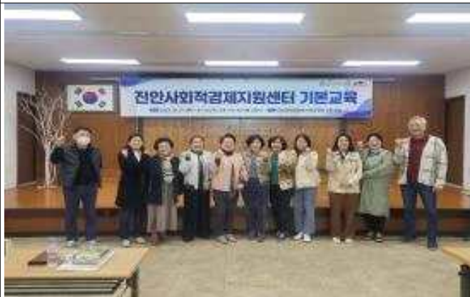
△2023 사회적경제 기본교육 개강