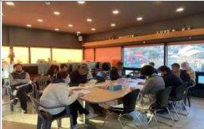
△2023 사회적경제 공부모임(경세통) 진행