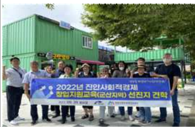
△2022 사회적경제 창업지원교육