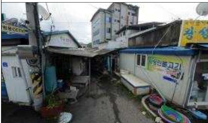
우화지구 골목길 재포장(전)