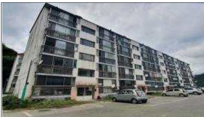
사업부지 전경(건월마을아파트 가동)