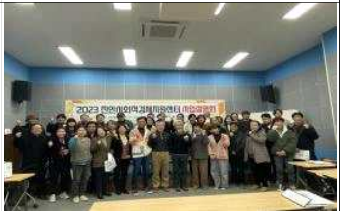
△2023 사회적경제 사업설명회 개최